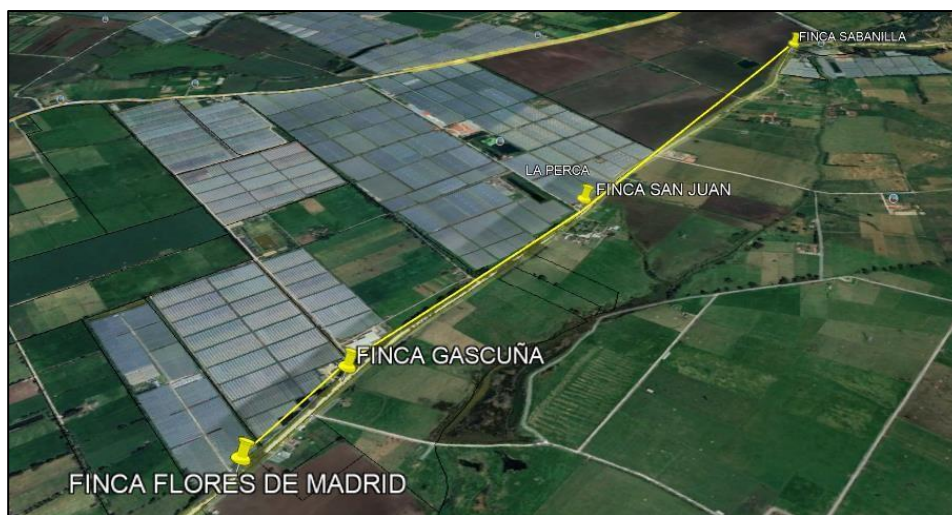
Ilustración 1. Ubicación de predios

Teniendo en cuenta que ante el municipio de Funza se interpuso queja por riego a la vía pública causando mal olor y daños a esta por parte de una empresa de cultivo de flores, se realizó recorrido de control y vigilancia (Ruta amarilla), en la vereda El Cacique - sector de Tienda Nueva el día 21 de marzo del presente año por parte del personal adscrito a la Secretaría de Ambiente y Bienestar Animal, desde las coordenadas 4°44'54.257" N y 74°10'22.758" W hasta las coordenadas 4°47'32.91" N y 74°13'13.542" W, como se muestra en la siguiente ilustración: