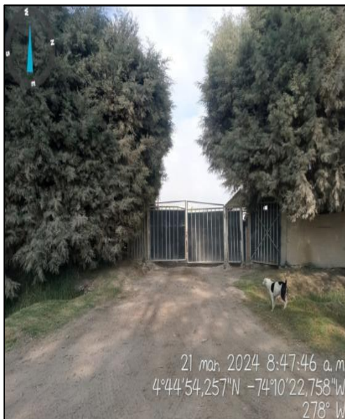
Ilustración 2. Finca Flores de Madrid

C.P. 250020 Tel. +57(1) 823 40 70 823 40 71 / 823 40 73 Fax. +57(1) 825 76 20 Dir. Cra. 14 No. 13-05