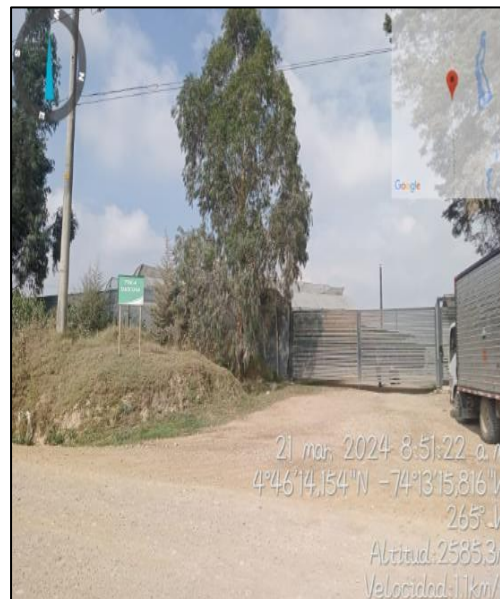
Ilustración 3. Finca Gascuña