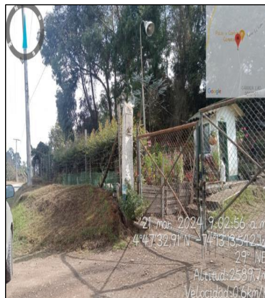
Ilustración 5. Finca Sabanilla